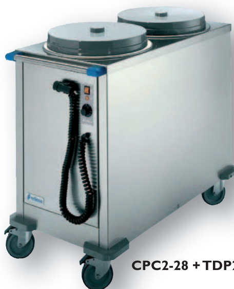
CPC2-28 + TDP28