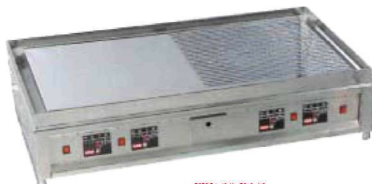
ERU 20 R1/2