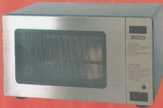
ER 1042 C