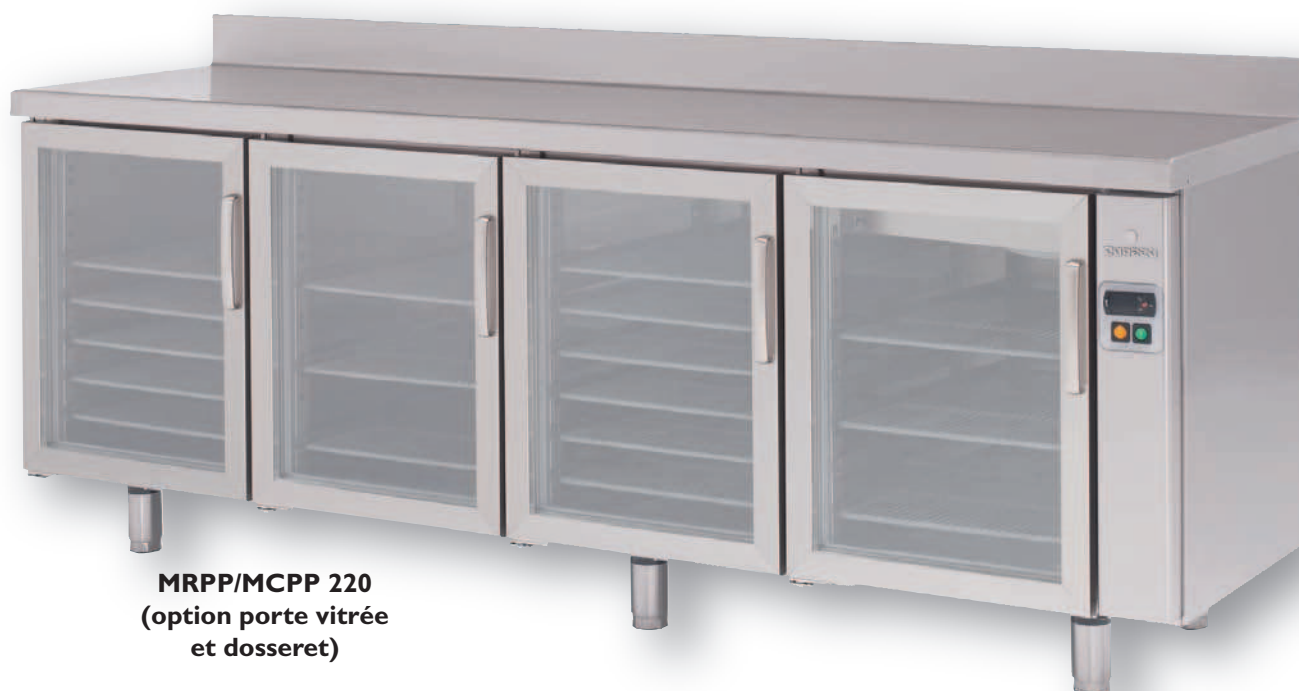
MRPP/MCPP 220 (option porte vitrée et dossier)