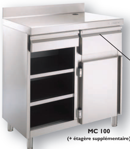
Trémie à café