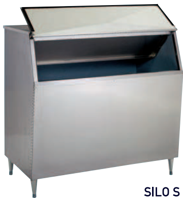
SILO S 500

Nel SILO SC850 i carrelli trasportatori evitano di prendere il ghiaccio con la paletta e di sollevare cubetti pesanti con la conseguente possibilità di manipolare elevate quantità di ghiaccio.